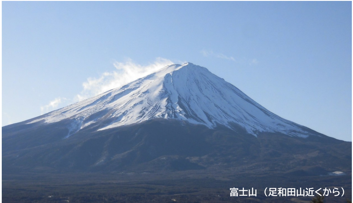
富士山 (足和田山近くから)

<交信相手局部門> ●巻末の移動地一覧の相手局毎の 総数です。●表彰局は会員外局で す。●Step Up は20 回毎です。 2380(2372) JA3WPN(表彰局) 40(39) 7M1VUE(表彰局) 昇進 A Class(B Class) 10(9) 7L1CRG 10(7) JAOMIC 10(8) JA3NAP 10(9) JE1LHW 10(9) JJ2CDP 10(9) JK1ORM 10(9) JL7XNP 10(9) JP3LVI