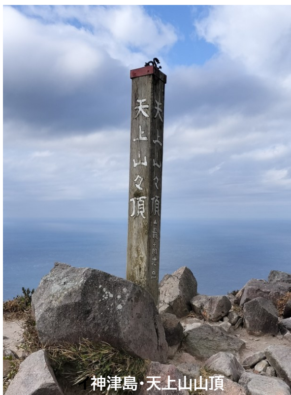
神津島・天上山山頂