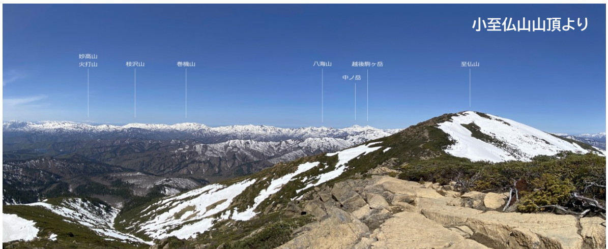
小至仏山山頂より