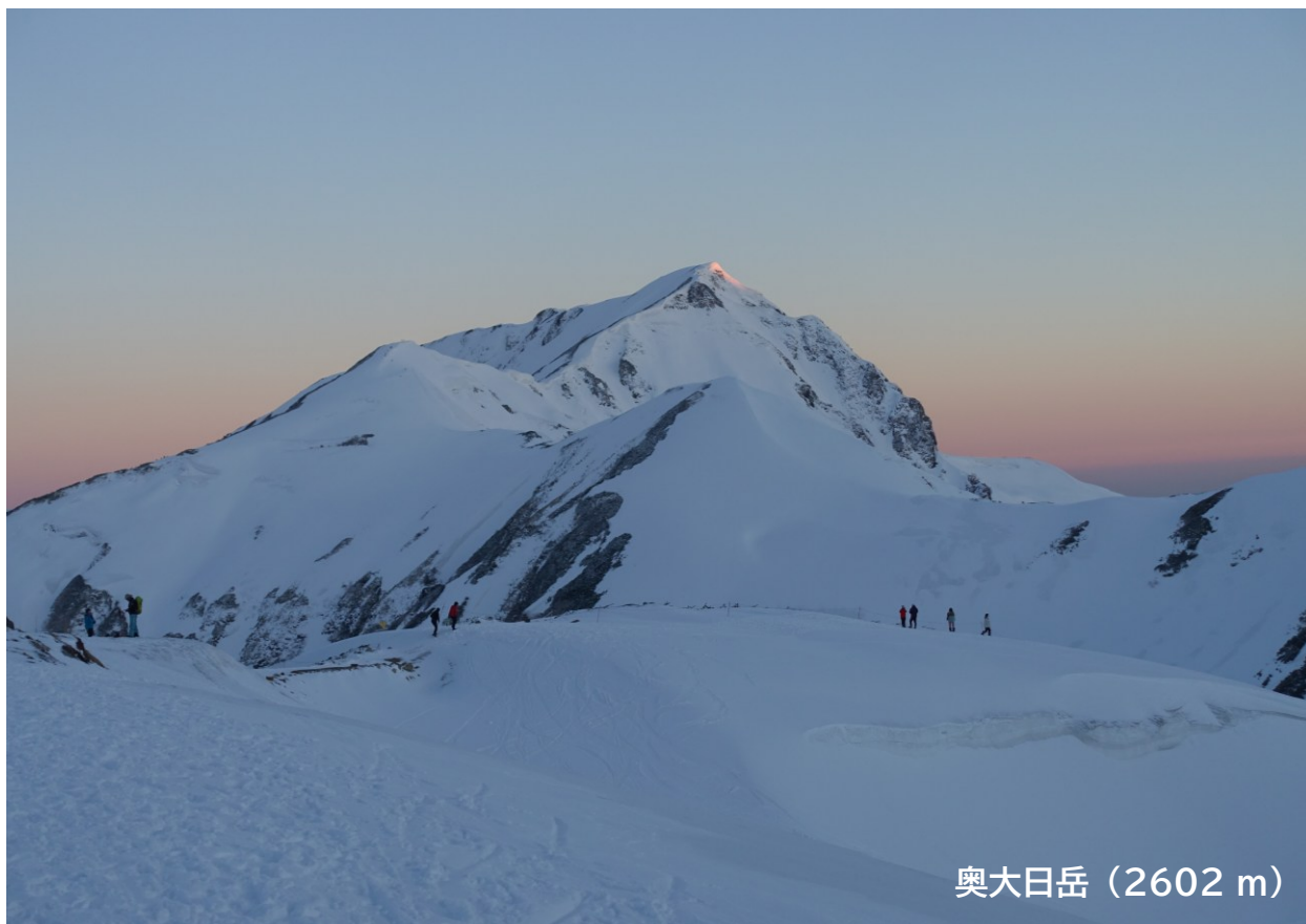
奥大日岳 (2602 m)