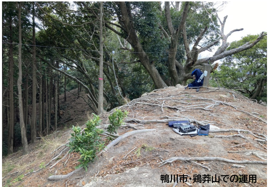
鴨川市・鶏芥山での運用