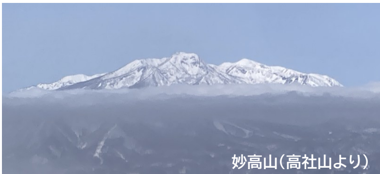
妙高山(高社山より)