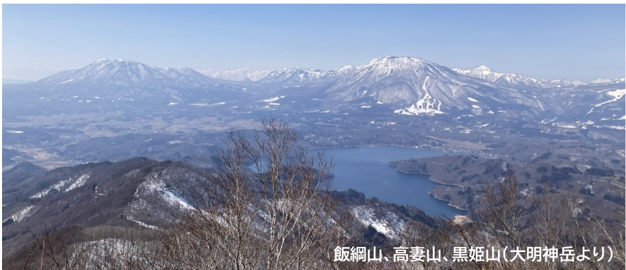
飯綱山、高妻山、黒姫山(大明神岳より)