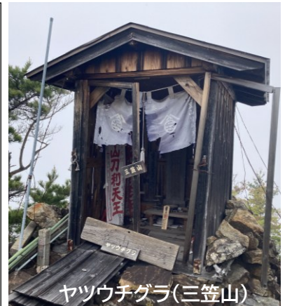
ヤツウチグラ(三笠山)